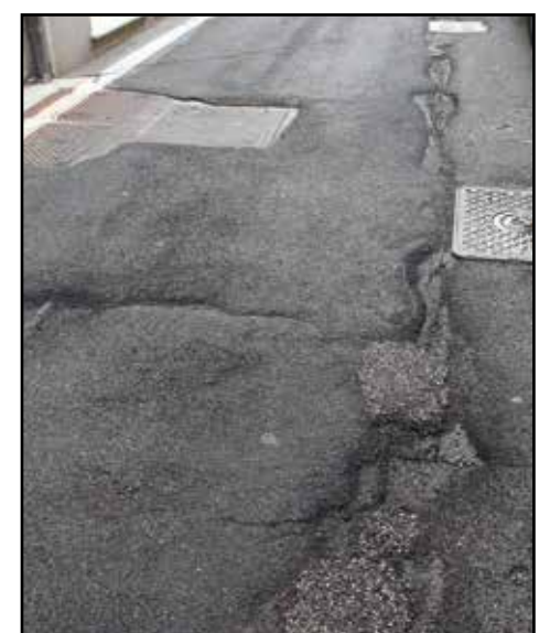
Le pessime condizioni di via P.Z. Alberti.

R ecentemente la giunta comunale di Montichiari ha approvato il progetto definitivo-esecutivo dei lavori di manutenzione straordinaria delle strade. La spesa complessiva, compresi tutti gli oneri, è di 810.000 euro, stanziamento previsto per il 2018. Sicuramente i lavori saranno effettuati in primavera (si vota a fine maggio per le amministrative) ed interesseranno tratti di diverse vie fra le quali come detto, via Pietro Zocchi Alberti attualmente con una situazione di degrado al limite della viabilità. Altri interventi attesi