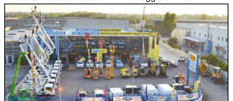
La nuova sede della Noleggio Lorini in zona industriale, via E. Montale 15.

SEDE: MONTICHIARI (BS) - Via E. Montale, 15 FILIALI: CALCINATO - CASTEGNATO tel. 030.9650556 - www.noleggiolorini.com