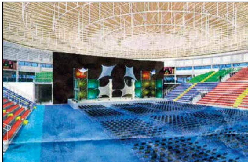
Il Palaleonessa in versione teatro: può ospitare 4.300 persone, tutte a sedere.

A caratteri cubitali sul giornale di Brescia il titolo. AL PALALEONESSA UN